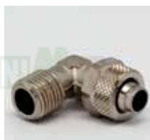
CÓDIGO Macho giratorio RSM16 Macho fijo RSM05